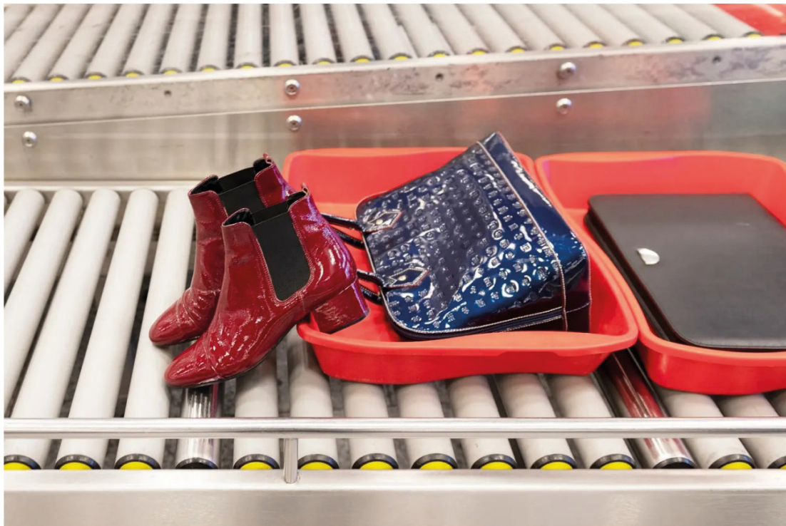
Auch die Vebegeo-Airport-Personalchefin muss täglich durch die Sicherheitskontrolle, bevor sie ihr Büro auf dem Flughafen Zürich erreicht.

Am Rande des Rollfelds trinkt Sikon jeweils ihren Pausenkaffee und schaut den schweren Maschinen beim Starten und Landen zu. Derzeit gibt es meist nur die riesige, leere Betonfläche zu betrachten; und für Vebegeo Airport fällt viel weniger Arbeit an als üblich. Sikon selbst ist zwar gut ausgelastet, nur schon die Erfassung der Kurzarbeitsgesuche beansprucht viel Zeit. Dennoch schwingt viel Wehmut mit, wenn sie von ihrem «normalen» Arbeitstag vor der Pandemie erzählt. Dieser beginnt immer mit dem Blick auf die Abflugtafel. «Heute ist Donnerstag, das wäre ein Langstreckentag», sagt sie. Ganze 18 Flüge sind an diesem Nachmittag aufgelistet: zweimal Frankfurt, Dubai und kurz vor 22 Uhr noch die Malediven – ein wenig Gratis-Fernweh, immerhin.